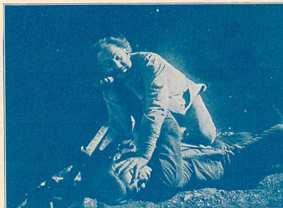
Une scène de Sarati le Terrible .

dans Sarati le Terrible , d'après le roman de J. Vignaud.