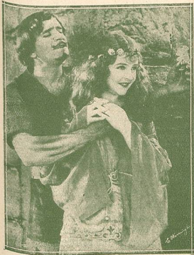
DOUGLAS FAIRBANKS dans ROBIN DES BOIS