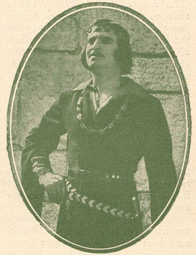
DOUGLAS FAIRBANKS dans ROBIN DES BOIS

A vant de partir aux Croisades, Richard Cœur-de-Lion a convié tous ses chevaliers à venir déployer leur force et leur valeur dans un grand tournoi. Il a décidé de donner au vainqueur de la fête le commandement général de la Croisade. Les deux plus redoutables champions sont Guy de Gisbourne, homme ambitieux, sans scrupule, et le Comte de Huntingdon, favori du roi. Après les premières passes d'armes, Gisbourne et Huntingdon se trouvent face à face. Leur rencontre est terrible, mais Huntingdon finit par triompher, et au milieu des acclamations générales, Richard Cœur-de-Lion le proclame commandant-chef des croisades. Fêtes... Banquets... Au milieu de toutes ces réjouissances, Richard constate avec tristesse que Huntingdon, au lieu de rechercher la présence de quelque demoiselle, préfère la société des soldats. Le Roi fait attacher Huntingdon à une colonne de pierre et déclare qu'il est prêt à doter en terres, château et écus celle qui, parmi les dames de la cour, saura