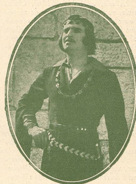
DOUGLAS FAIRBANKS dans ROBIN DES BOIS