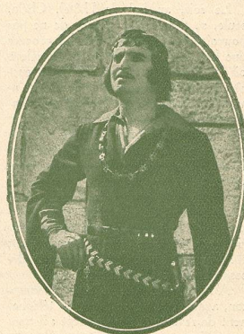
DOUGLAS FAIRBANKS dans ROBIN DES BOIS