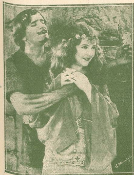
DOUGLAS FAIRBANKS dans ROBIN DES BOIS