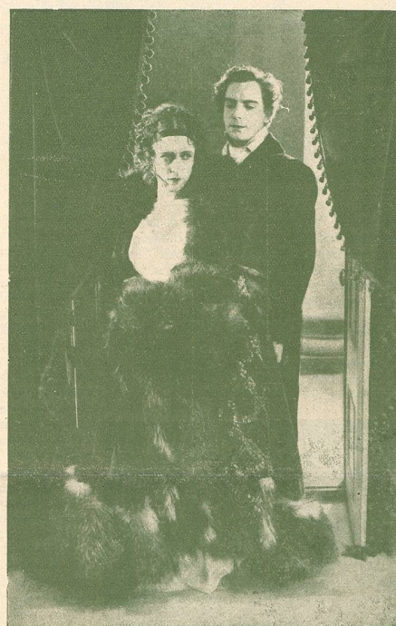
LARS HANSON et JENNY HASSELQVIST dans La Légende de Gösta Berling.