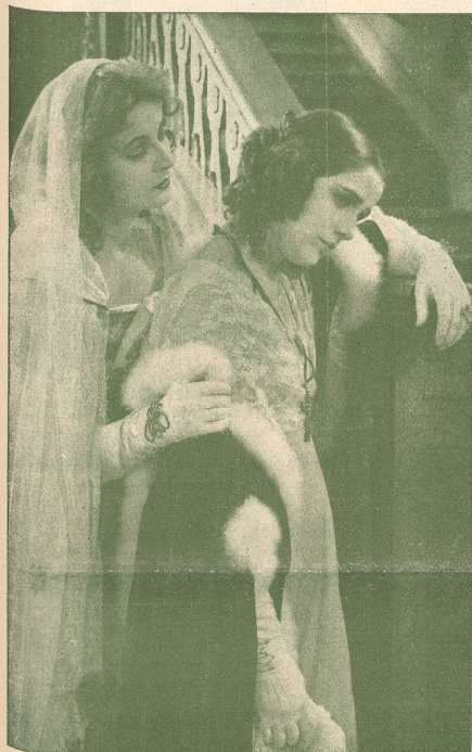
Une scène de La Légende de Gösta Berling.