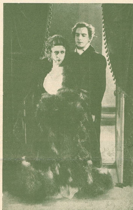
LARS HANSON et JENNY HASSELOQUIST dans La Légende de Gösta Berling.