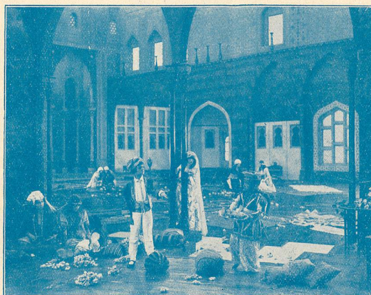
La Femme de l'Orient.