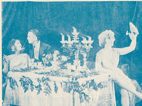
Le Réveil de Maddalone

Régie des Annonces : 5, Rue de Genève, 5, LAUSANNE.