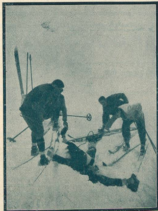
Une scène du film UN RÊVE DE BONHEUR.