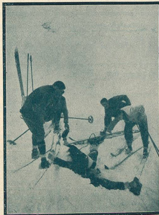
Une scène du film UN RÊVE DE BONHEUR.