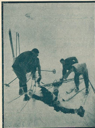
Une scène du film UN RÊVE DE BONHEUR.