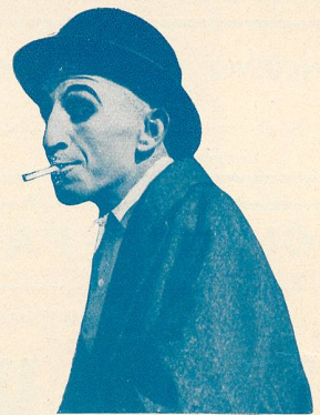
ZIGOTO est au Modern-Cinéma

extraordinaire et unique d'une tempête avec sauvetage de navire comme l'on a jamais vu au cinéma. Les Naufragés de la Vie est à lui seul un spectacle de tout premier ordre qui est à recommander au public. Egalement au programme Pierrot et Pierrette , interprété par René Poyen (ex Bout-de-Zan) et la petite Bouboule et Charpentier, est une comédie dramatique et humoristique en 3 parties. A chaque représentation le Ciné-Journal suisse, avec ses actualités mondiales et du pays.