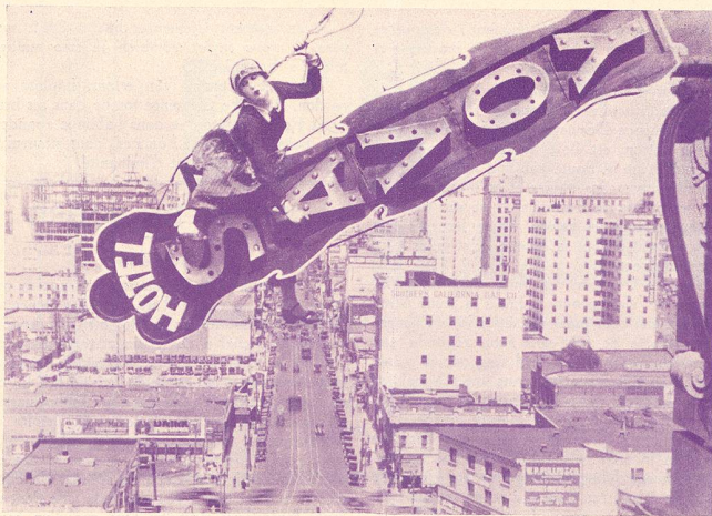
(Dorothy DEVORE) Une des scènes angoissantes de HOLD YOUR BREATH

Ce soir-là, Larouette, tout à ses soucis matériels, tarda longtemps à rentrer auprès de sa chère femme Henriette et de sa fille Suzanne. L'heure du dîner était passée depuis longtemps ; la mère et la fille attendaient à la véranda lorsqu'elles virent les fenêtres de Larouette s'éclairer