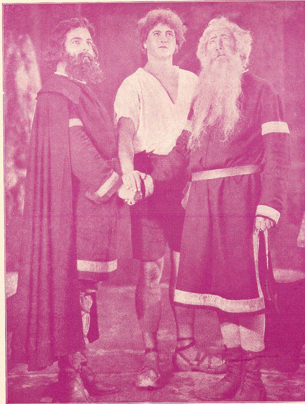
LE SERMENT DES TROIS SUISSES

Dans cette œuvre, qui repose de tant de niaiseries et d'outrances, on voit passer comme les strophes d'un poème pastoral, les scènes classiques des premiers temps de la Confédération : la place d'Altdorf et sa vie rurale, les exactions des baillis, les premiers signes de la révolte populaire, les épisodes de Tell et de Gessler, Stauffacher outragé devant sa maison, Melchthal, fuyant la vengeance des tyrans, Furst dans sa demeure patriarcale, les conciliabules qui précèdent la première alliance, l'expulsion des baillis et enfin, la bataille de Morgarten, qui est la finale de l'œuvre.