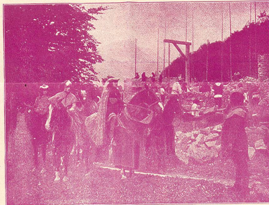
La Construction de la Prison

Il faut admirer les résultats auxquels on est arrivé avec un minimum d'acteurs professionnels.