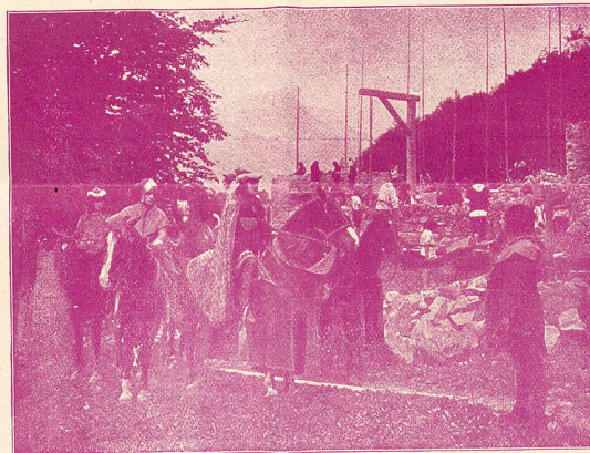
La Construction de la Prison

Il faut admirer les résultats auxquels on est arrivé avec un minimum d'acteurs professionnels.