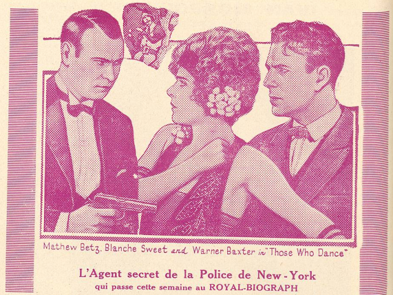
Mathew Betz, Blanche Sweet and Warner Baxter in "Those Who Dance"

Le spectacle commencera par la partie cinématographique et dès 9 h. 45 le spectacle continuera sur la scène avec le célèbre magicien De Rocroy et sa compagnie qui ne sont visibles qu'en soirée seulement. Le programme des matinées est essentiellement cinématographique, dimanche