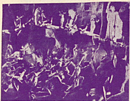
Une scène des saisissantes visions de Dante dans le grand film L'Enfer du Dante . Cliché Fox Film.

Une photo inédite du célèbre singe Bib des Impérial Comédies de Fox Film qui stupéfie les foules par son jeu extraordinaire dans le film Darwin avait raison . Cliché Fox Film.