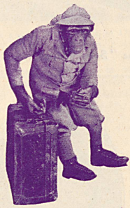
Le maraudeur de Bagdad

Une photo inédite du célèbre singe Bib des Impérial Comédies de Fox Film qui stupéfie les foules par son jeu extraordinaire dans le film Darwin avait raison .