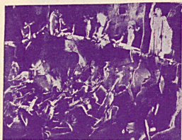
Une scène des saisissantes visions de Dante dans le grand film L'Enfer du Dante . Cliché Fox Film.

Une photo inédite du célèbre singe Bib des Impérial Comédies de Fox Film qui stupéfie les foules par son jeu extraordinaire dans le film Darwin avait raison . Cliché Fox Film.