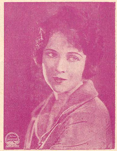
LOGAN une vedette de la Paramount

ADMINISTRATION et RÉGIE DES ANNONCES : Avenue de Beaulieu, 11, LAUSANNE — Téléph. 82.77 ABONNEMENT : Suisse, 8 fr. par an ; 6 mois, 4 fr. 50 :: Etranger, 13 fr. :: Chèque postal N° 11. 1028 RÉDACTION : L. FRANÇON, 22, Av. Bergières, LAUSANNE :: Téléphone 35.13