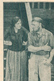
Une scène de La Nuit de la Revanche Vanel, chef des contrebandiers.

Douglas Fairbanks dans Robin des Bois passe cette semaine au Cinéma du Bourg