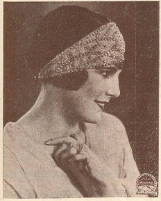
LEATRICE JOY une vedette de la Paramount