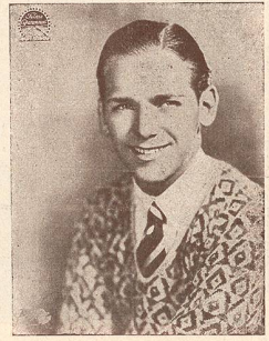
Douglas FAIRBANKS junior une vedette de la Paramount