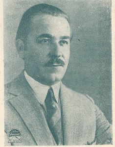
NOAH BEERY une vedette de la Paramount

ADMINISTRATION et RÉGIE DES ANNONCES : Avenue de Beaulieu, 11, LAUSANNE — Téléph. 82.77 ABONNEMENT : Suisse, 8 fr. par an; 6 mois, 4 fr. 50 :: Etranger, 13 fr. :: Chèque postal N° 11. 1028 RÉDACTION : L. FRANÇON, 22, Av. Bergières, LAUSANNE :: Téléphone 35.13