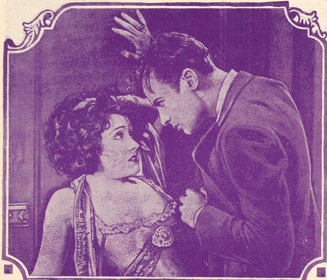
GLORIA SWANSON dans „la Huitième Femme de Barbe-Bleue”