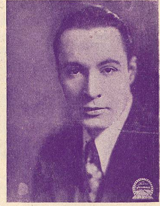
R. LA ROCQUE. une vedette de la Paramount