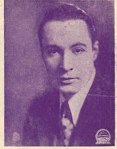
R. LA ROCQUE. une vedette de la Paramount