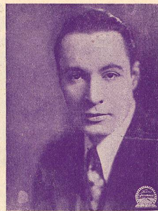
R. LA ROCQUE. une vedette de la Paramount