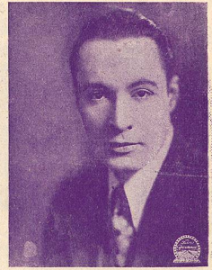
R. LA ROCQUE. une vedette de la Paramount