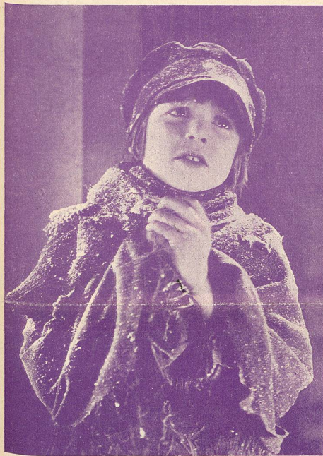
Une émouvante expression de JACKIE COOGAN dans le rôle de Nello .

tiré du célèbre roman de OUIDA A DOG OF FLANDERS adapté pour l'écran par Victor Schertzinger.