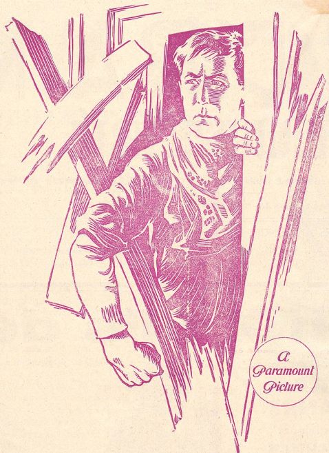
W. S. HART alias RIO JIM dans Cœur de Brigand passe cette semaine au Cinéma-Palace.

Le Rayon Mortel, c'est le dernier mot de la guerre de demain, le rêve le plus audacieux réalisé par les stratèges futurs. Ce que les Jules Verne et les Wells avaient prévu dans leurs théories romanesques devient un fait accompli. Une dose de dix grammes suffit pour anéantir une ville entière, partout la ruine et les hommes anéantis sous les décombres. Sur cette invention horrible est tissé l'histoire du film que nous voyons. L'inventeur Newman travaille pour la firme Hackett, le fondateur de cette société est mort il y a dix ans, laissant à son frère Marcin Hackett, le soin de veiller sur Barbara, sa fille et unique héritière, mais le savant est un joueur invétéré, il perd au jeu la fortune de l'héritière, il espère cependant que son invention lui permettra de combler le déficit. Malheureusement, un second tube de cette matière est en possession d'un arriviste insatiable, il faut le lui enlever, c'est ce qui motive une poursuite effrénée, elou de cette histoire, qui se termine par le mariage de Barbara, qui restera malgré tout la riche héritière pour le plaisir de son fiancé et du public qui a suivi avec passion cette trépidante aventure. Les acteurs principaux de ce drame, sont Schirley, Mason et Buck Jones, dont nous donnons les portraits à la première page de ce numéro.