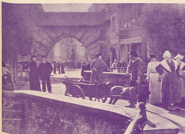
Une scène de L'Enfant des Flandres .