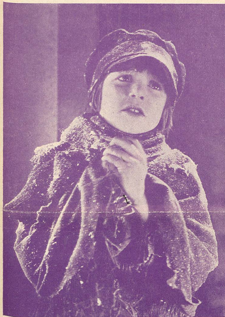
Une émouvante expression de JACKIE COOGAN dans le rôle de Nello .

tiré du célèbre roman de OUIDA A DOG OF FLANDERS adapté pour l'écran par Victor Schertzinger.