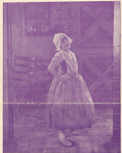
JACKIE COOGAN dans le rôle d'une petite flamande Aloys la fille du riche meunier Baas Cogez.

À l'occasion de la Nouvelle Année L'Ecran Illustré exprime à tous ses lecteurs ses meilleurs souhaits de bonheur et de prospérité.