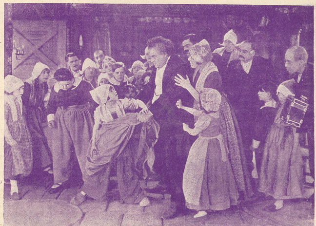
Une scène de L'Enfant des Flandres .