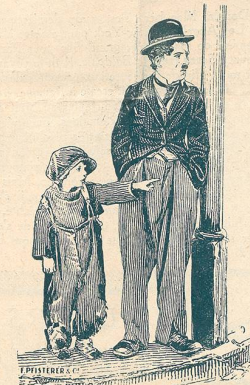
Une scène du film Le Gagnant prend Tout. Une remarquable production de la Fox Film.