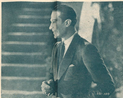
Une scène du film L'Hacienda Rouge.

Nous voyons dans ce film le beau, irrésistible Valentino, la coqueluche du sexe, faible ; il a comme partenaire féminin Nita Naldi. L'action se passe dans l'Amérique du Sud. Un noble espagnol a jadis fiancé son fils, le brillant Alonso, à une jeune fille d'un ami de Madrid. Le mariage doit avoir lieu, mais la fille du majordome, du marquis, qui est amoureuse de Alonso, en conçoit un sauvage dépit. La nuit du mariage, elle fait enlever la fiancée d'Alonso par un brigand des pampas. Alonso n'a qu'un désir, c'est de reprendre sa fiancée au Tigre, c'est ainsi qu'on nomme le brigand ravisseur, mais, par un subterfuge de Carlotta, la fille du majordome, Alonso croit que sa fiancée est tombée amoureuse du Tigre ; de désespoir il s'enfuit et nous le retrouvons dans un café à matelots d'un port sud-américain. Un soir, on signale à Alonso la présence du Tigre dans un bar du port ; il s'y rend et un ami zélé d'Alonso étrangle le brigand. Carlotta, qui se trouve aussi là, tombée au dernier rang de la dégradation, apprend à Alonso que sa fiancée n'a jamais cessé de l'aimer mais que le Tigre connaissait seul le refuge de Juliette et que sa mort a anéanti le secret. Cependant Alonso finit par retrouver sa fiancée dans un couvent où elle était sur le point de prononcer les grands vœux éternels, car elle croyait qu'Alonso était mort. On devine la conclusion.