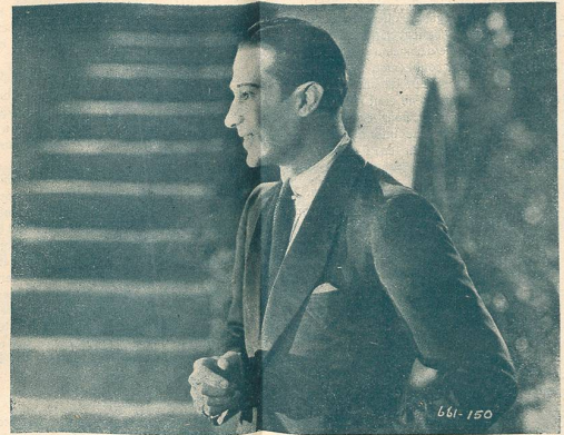
Une scène du film L'Hacienda Rouge.

Nous voyons dans ce film le beau, l'irrésistible Valentino, la coqueluche du sexe faible : il a comme partenaire féminin Nina Naldi. L'action se passe dans l'Amérique du Sud. Un noble espagnol a jadis fiancé son fils, le brillant Alonso, à une jeune fille d'un ami de Madrid. Le mariage doit avoir lieu, mais la fille du majordome, du marquis, qui est amoureuse de Alonso, en conçoit un sauvage dépit. La nuit du mariage, elle fait enlever la fiancée d'Alonso par un brigand des pampas. Alonso n'a qu'un désir, c'est de reprendre sa fiancée au Tigre, c'est ainsi qu'on nomme le brigand ravisseur, mais, par un subterfuge de Carlotta, la fille du majordome, Alonso croit que sa fiancée est tombée amoureuse du Tigre ; de désespoir il s'enfuit et nous le retrouvons dans un café à matelots d'un port sud-américain. Un soir, on signale à Alonso la présence du Tigre dans un bar du port ; il s'y rend et un ami zélé d'Alonso étrangle le brigand. Carlotta, qui se trouve aussi là, tombée au dernier rang de la dégradation, apprend à Alonso que sa fiancée n'a jamais cessé de l'aimer mais que le Tigre connaissait seul le refuge de Juliette et que sa mort a anéanti le secret. Cependant Alonso finit par retrouver sa fiancée dans un couvent où elle était sur le point de prononcer les grands vœux éternels, car elle croyait qu'Alonso était mort. On devine la conclusion.