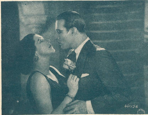
Une scène du film L'Hacienda Rouge.

passé cette semaine au Modern-Cinéma à Lausanne.