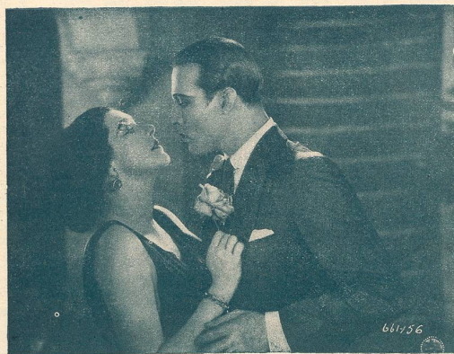
Une scène du film L'Hacienda Rouge.

avec RUDOLF VALENTINO passe cette semaine au Modern - Cinéma à Lausanne.