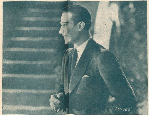
Une scène du film L'Hacienda Rouge.

Nous voyons dans ce film le beau, l'irrésistible Valentino, la coqueluche du sexe faible : il a comme partenaire féminin Nina Naldi. L'action se passe dans l'Amérique du Sud. Un noble espagnol a jadis fiancé son fils, le brillant Alonso, à une jeune fille d'un ami de Madrid. Le mariage doit avoir lieu, mais la fille du majordome, du marquis, qui est amoureuse de Alonso, en conçoit un sauvage dépit. La nuit du mariage, elle fait enlever la fiancée d'Alonso par un brigand des pampas. Alonso n'a qu'un désir, c'est de reprendre sa fiancée au Tigre, c'est ainsi qu'on nomme le brigand ravisseur, mais, par un subterfuge de Carlotta, la fille du majordome, Alonso croit que sa fiancée est tombée amoureuse du Tigre ; de désespoir il s'enfuit et nous le retrouvons dans un café à matelots d'un port sud-américain. Un soir, on signale à Alonso la présence du Tigre dans un bar du port ; il s'y rend et un ami zélé d'Alonso étrangle le brigand. Carlotta, qui se trouve aussi là, tombée au dernier rang de la dégradation, apprend à Alonso que sa fiancée n'a jamais cessé de l'aimer mais que le Tigre connaissait seul le refuge de Juliette et que sa mort a anéanti le secret. Cependant Alonso finit par retrouver sa fiancée dans un couvent où elle était sur le point de prononcer les grands vœux éternels, car elle croyait qu'Alonso était mort. On devine la conclusion.