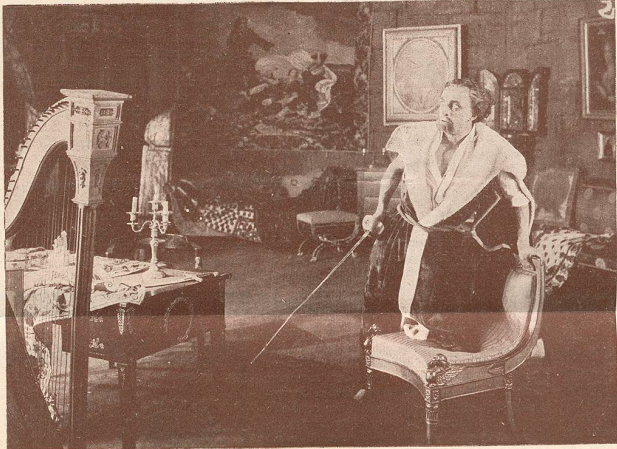
Une scène du film Le Comte Kostia .

la belle artiste écossaise qui joue pour la Fox Film et que nous avons admirée dans Hors du Gouffre .