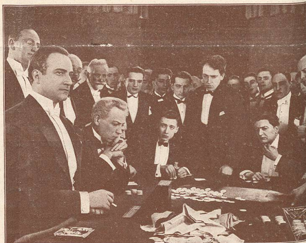
Une scène du film Le Double Amour qui passe cette semaine au CINÉMA-PALACE à Lausanne, avec Jean Angelo à gauche de l'image.

le célèbre acteur allemand que nous verrons cette semaine au THÉÂTRE LUMEN dans le rôle du Comte Kostia .