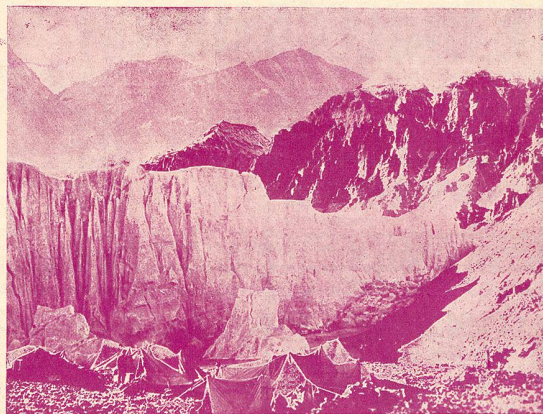
L'installation des dépôts sur le glacier Rongbuk (L'Inaccessible).