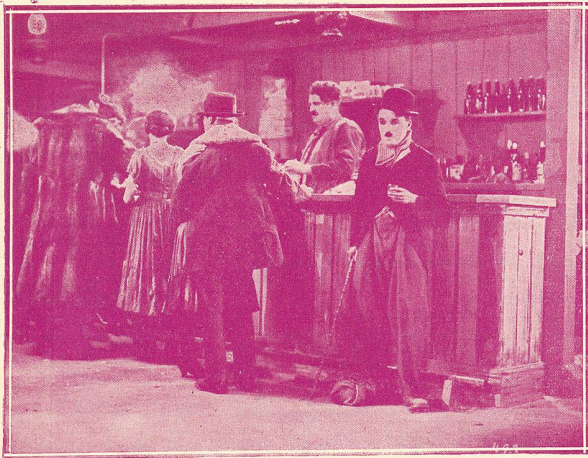
Une des principales scènes de LA FIÈVRE DE L'OR avec Charlie Chaplin.