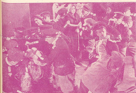
BETTY COMPSON au Cinéma Palace dans L'Ecole des Maris.