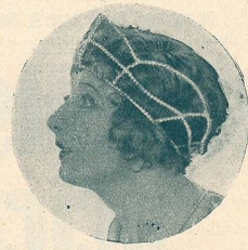
BETTY BLYTHE dans „Pour un Collier de Perles“.

Vous n'en saurez pas davantage pour aujourd'hui, vous ne saurez qu'en voyant le film s'il se termine en gaîté ou en tristesse. (Mon Ciné.)