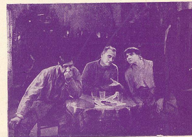
Les Deux Gosses