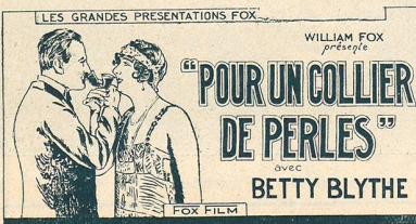
Ce film passe cette semaine au Royal-Biograph à Lausanne.

Le ménage fait cabine à part. Avant de se coucher, ils se sont dit des mots cinglants.