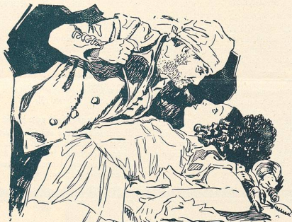
„Amours de Contrebandiers“ qui passe cette semaine au Théâtre Lumen.