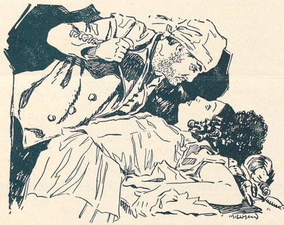
„Amours de Contrebandiers“ qui passe cette semaine au Théâtre Lumen.

„Moto-Film“ R. LINIGER & Co., Place de la Gare, 7, BERNE.