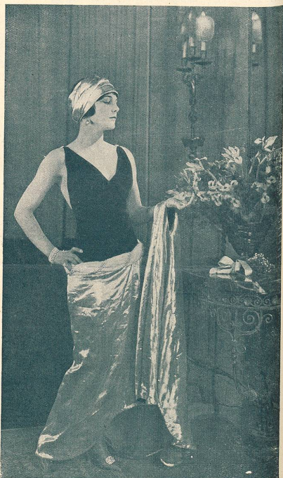
LEATRICE JOY dans LE RÉQUISITOIRE