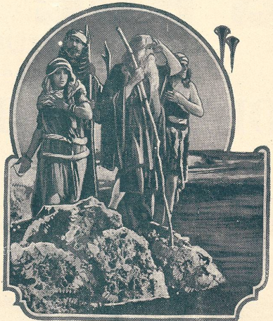
LES DIX COMMANDEMENTS passe au Cinéma du Bourg à Lausanne.

Vous passerez d'agréables soirées à la Maison du Peuple (de Lausanne).