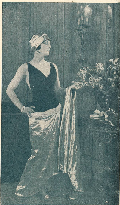
LEATRICE JOY dans LE RÉQUISITOIRE