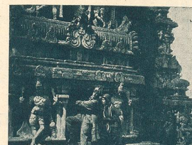
Quelques scènes du film passionnant Le Raid en Avion autour du Monde en location chez Pandora Film à Berne.

ACHETEZ notre magnifique ALBUM des 180 Vedettes du Cinéma. Fr. 1.50 net. S'adresser à l'Administration de L'ÉCRAN, 11, Av. de Beaulieu.