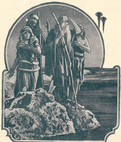
LES DIX COMMANDEMENTS passe au Cinéma du Bourg à Lausanne.

Vous passerez d'agréables soirées à la Maison du Peuple (de Lausanne).