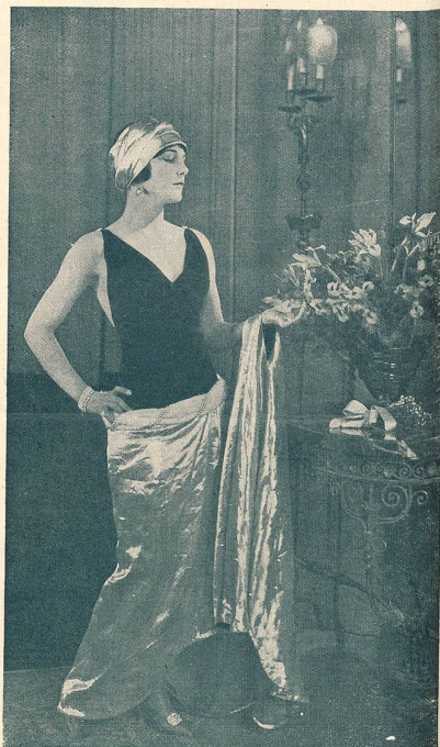
LEATRICE JOY dans LE RÉQUISITOIRE

Pola Negri IN "The Cheat" A GEORGE FITZMAURICE