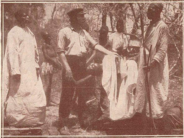
LIVINGSTONE le grand explorateur africain. Sa vie et son œuvre.

Mary Astor, dans le rôle de Dolores, a toute la grâce d'une innocente jeune fille de noble famille et sa beauté ne fait que parachever la valeur artistique de cette production. Ce film est fait pour charmer ; c'est l'amour jeune dans toute sa beauté, la splendeur des châteaux somptueux, les intrigues des cours royales et, par-dessus tout, le claquement d'un fouet vengeur mêlé au choc des épées scintillantes.