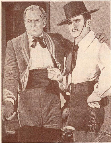
DOUGLAS FAIRBANKS dans Don X Zorro père. Production United Artists.