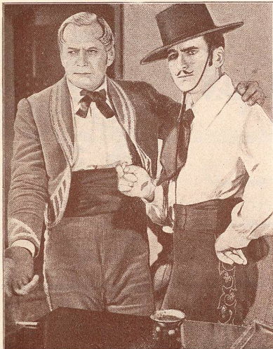
DOUGLAS FAIRBANKS dans Don X Zorro père. Production United Artists.