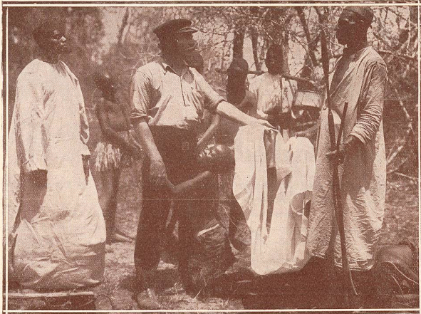
LIVINGSTONE le grand explorateur africain. Sa vie et son œuvre.

Mary Astor, dans le rôle de Dolores, a toute la grâce d'une innocente jeune fille de noble famille et sa beauté ne fait que parachever la valeur artistique de cette production. Ce film est fait pour charmer ; c'est l'amour jeune dans toute sa beauté, la splendeur des châteaux somptueux, les intrigues des cours royales et, par-dessus tout, le claquement d'un fouet vengeur mêlé au choc des épées scintillantes.