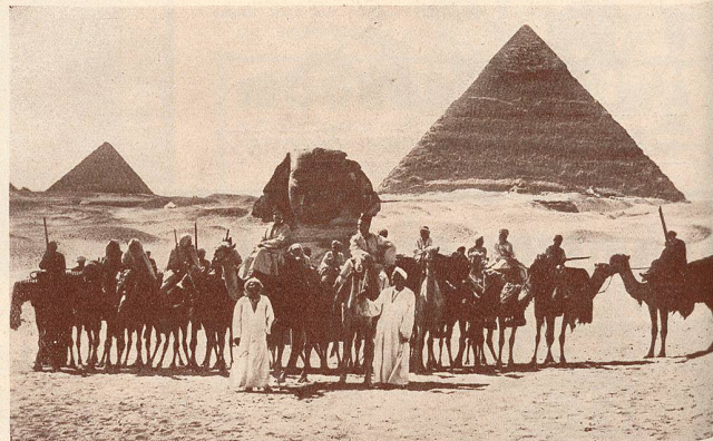
Une scène du Raid en Avion autour du Monde.

Partis de Paris, ils se sont dirigés par Marseille vers l'Egypte, ont traversé la Mer Rouge et l'Océan Indien, touchant aux régions les plus intéressantes des Indes, se transportant ensuite