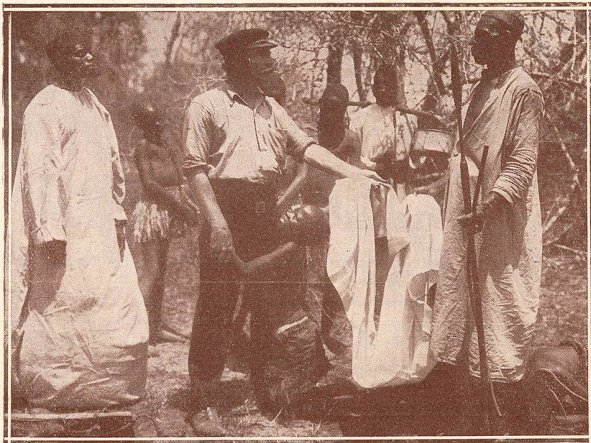
LIVINGSTONE le grand explorateur africain. Sa vie et son œuvre.

Mary Astor, dans le rôle de Dolores, a toute la grâce d'une innocente jeune fille de noble famille et sa beauté ne fait que parachever la valeur artistique de cette production. Ce film est fait pour charmer ; c'est l'amour jeune dans toute sa beauté, la splendeur des châteaux somptueux, les intrigues des cours royales et, par-dessus tout, le claquement d'un fouet vengeur mêlé au choc des épées scintillantes.