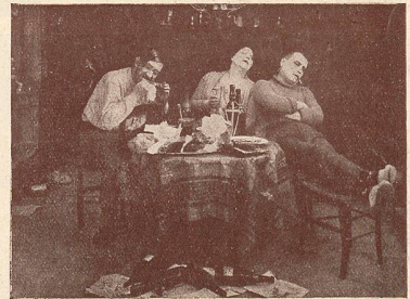
Une scène des Deux Gosses.