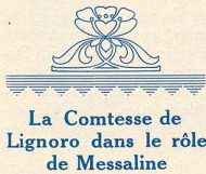
La Comtesse de Lignoro dans le rôle de Messaline

Les réalisateurs italiens peuvent seuls nous donner l'illusion de pareilles survivances qui ont toute la vraisemblance de la vérité. Ajoutez à ces cons-