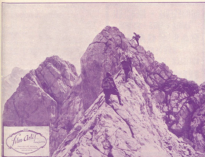
L'expédition lourdement chargée du matériel cinéma, atteint l'arête où elle a peine à se tenir debout.